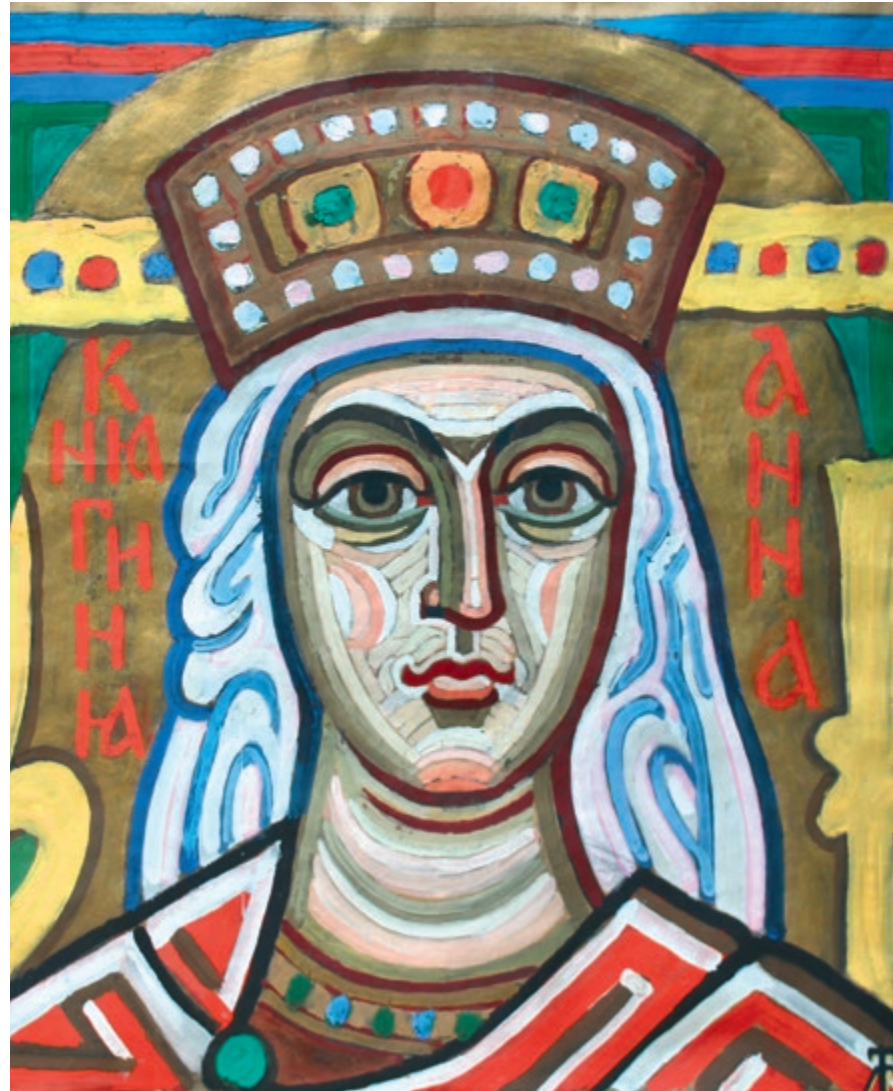
Картон до мозаїки «Княгиня Анна» | 2009