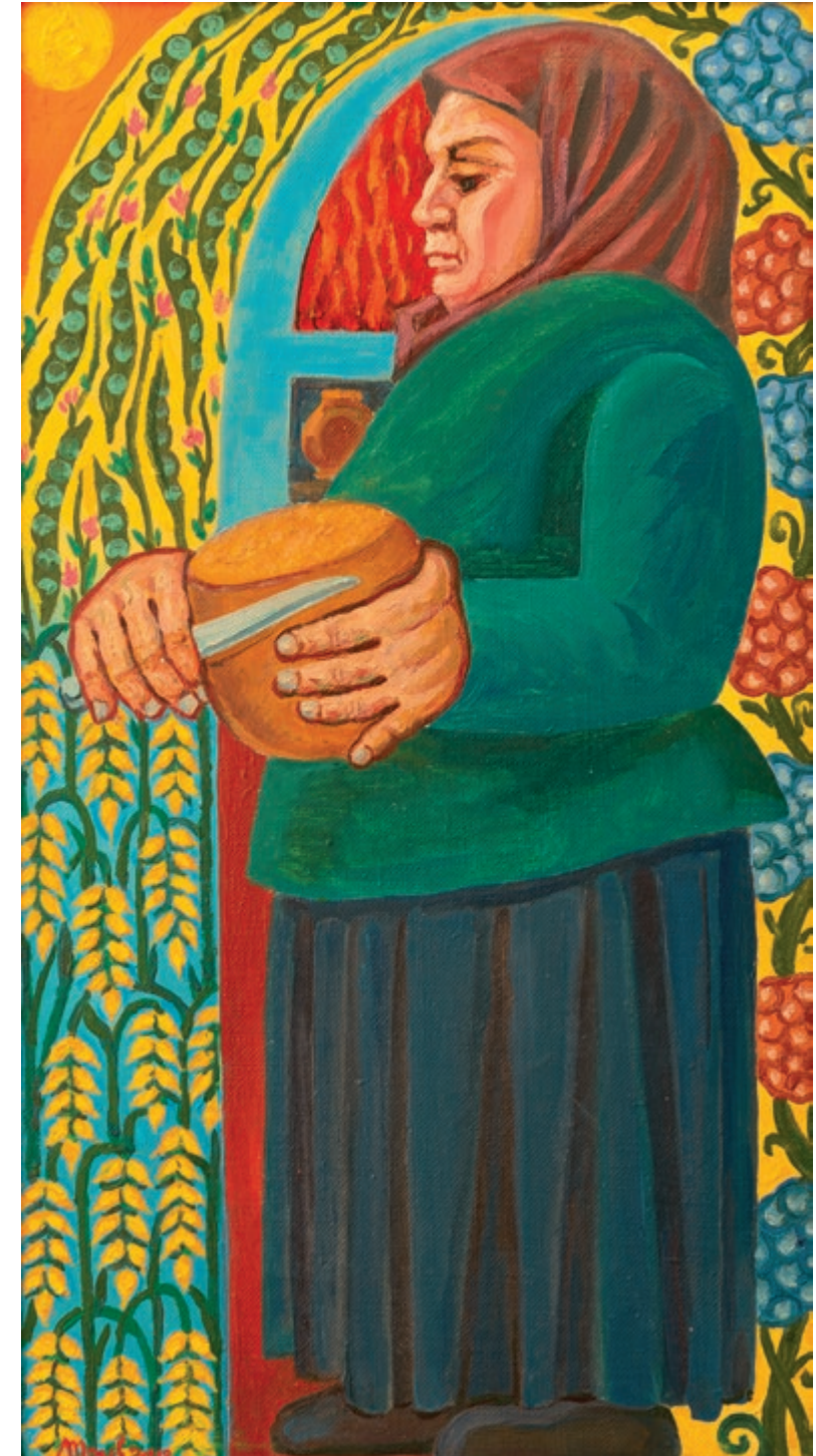
Хліб наш насущний | 2018 Полотно, олія. 77×43 | стор. 129 >>