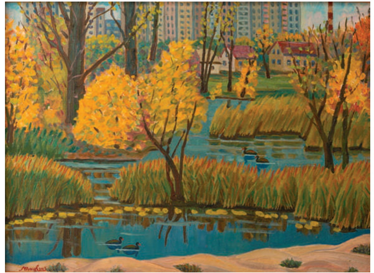
Позняки. Київ. Осінній пейзаж | 2013 Полотно, олія. 63×83