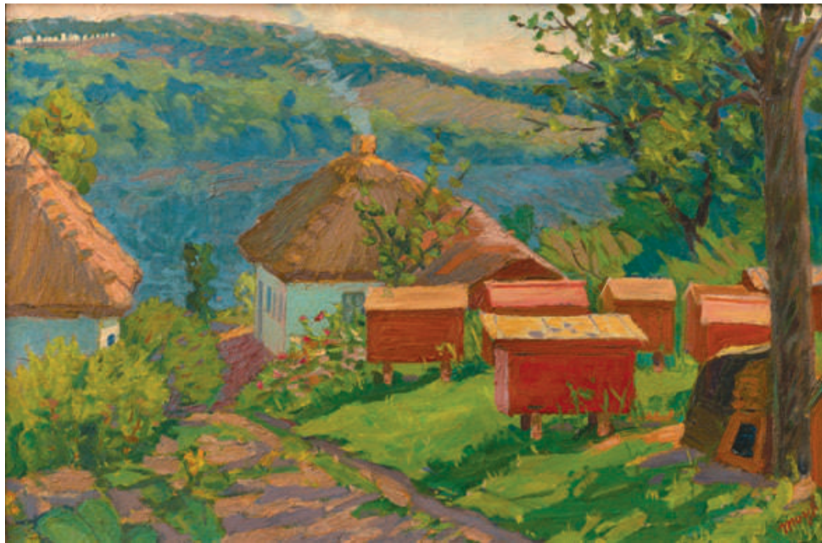
Село Щучинка. Пасіка | 1964 Картон, олія. 52×77