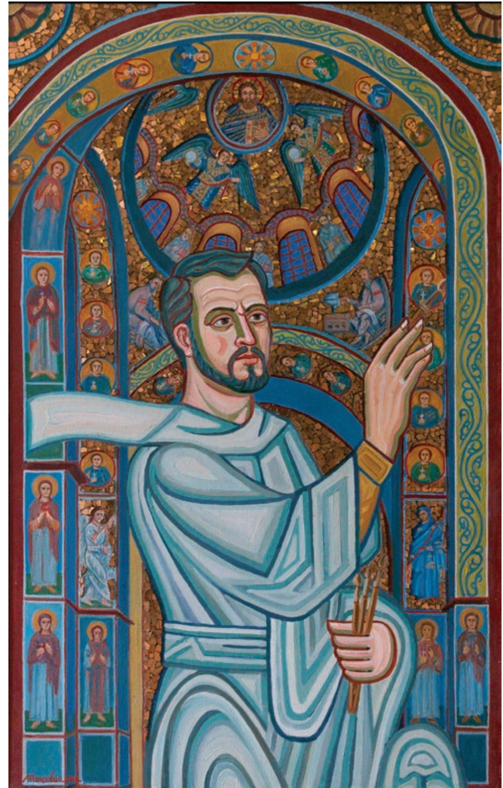
Художник-реставратор. Автопортрет | 2013 Полотно, олія, смальта. 160×100 | стор. 125 >>