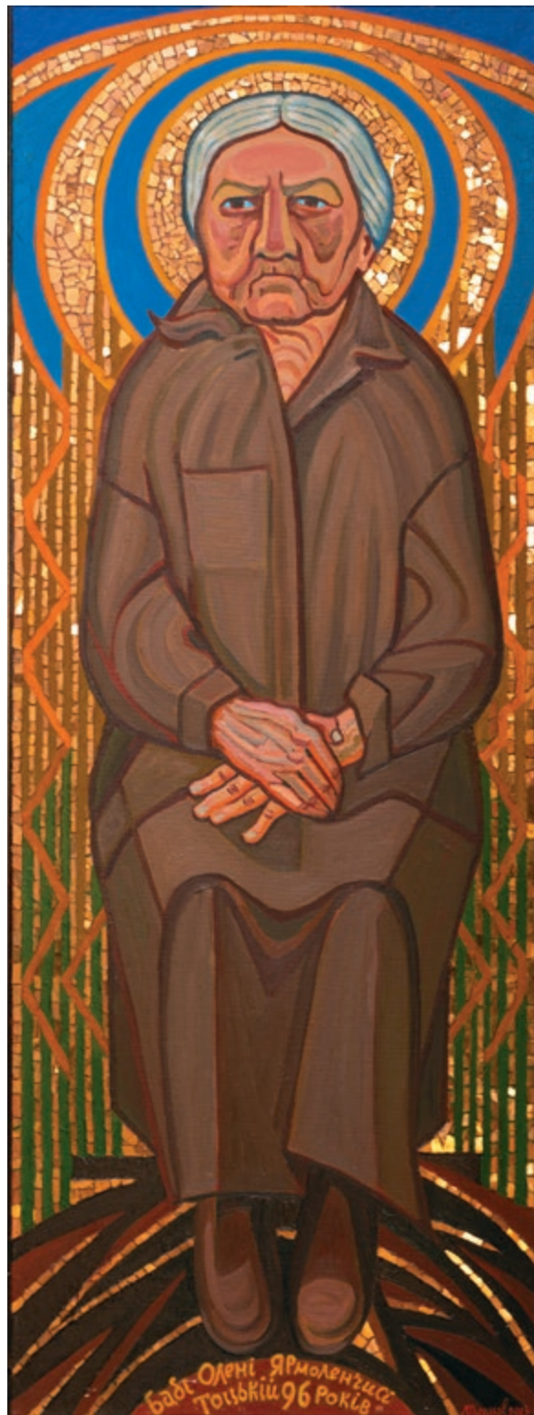
Баба Яромленчиха Тощька | 2013 Полотно, олія, золота смальта. 175×65