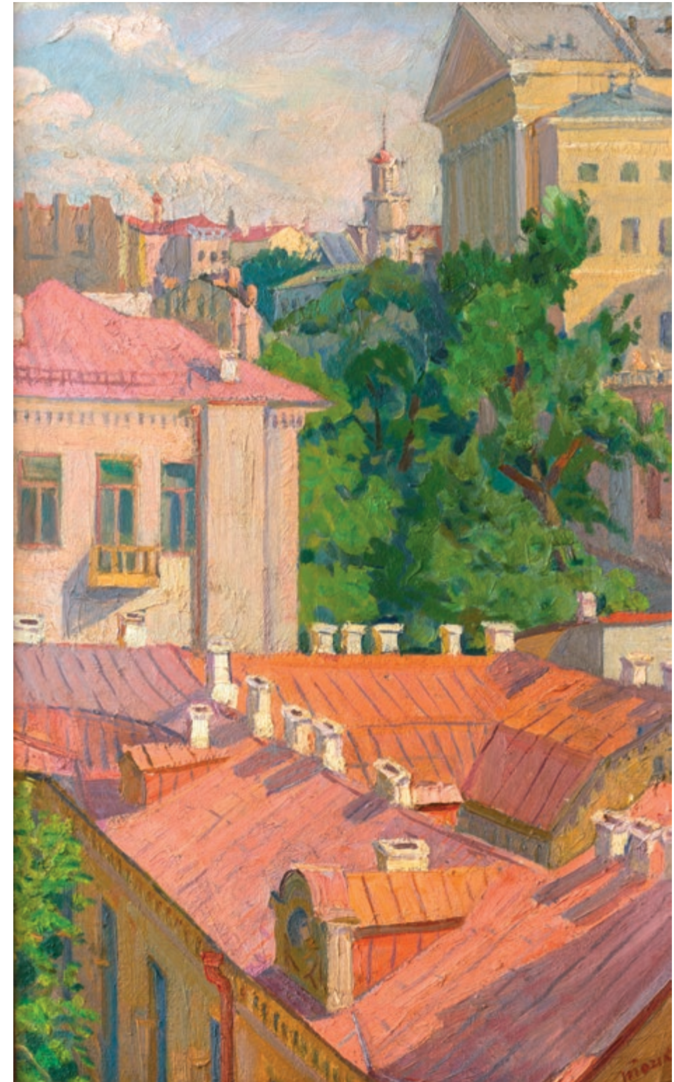
Київський пейзаж | 1963 Картон, олія. 73×47 | стор. 141 >>