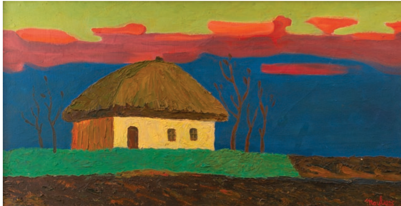
Хата вдови, село Лехнівка | 2007 Полотно, олія. 45×85