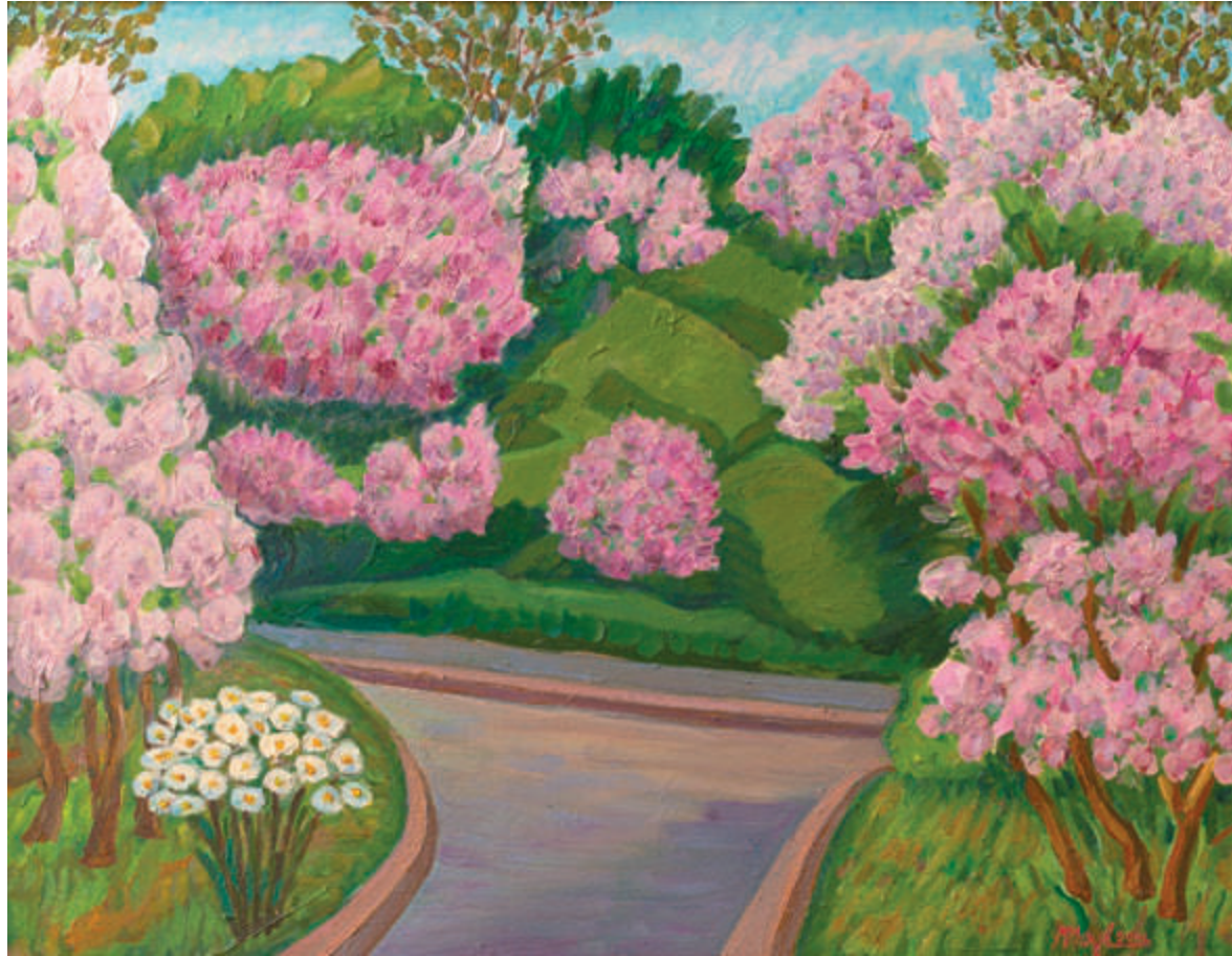
Квітне бузок в Ботанічному саду | 2012 Полотно, олія. 65×86