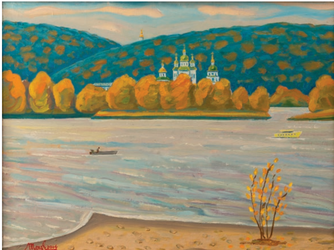
Видубичі. Пейзаж з лівого берега | 2007 Полотно, олія. 58×77