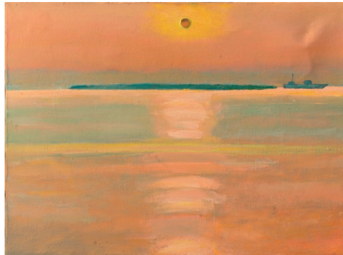
Захід сонця на морі | 2017 Полотно, олія, золота смальта. 60×80