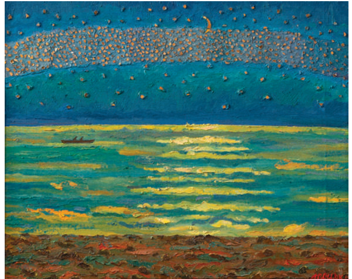
Чумацький шлях. Море | 2016 Полотно, олія, золота смальта. 52×62