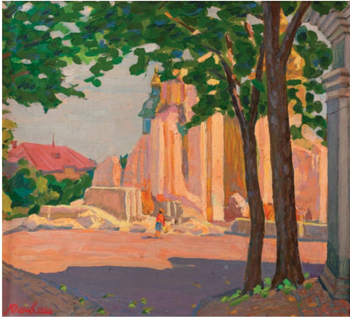
Руїни Успенського собору. Київська Лавра | 1966 Картон, олія. 46×50