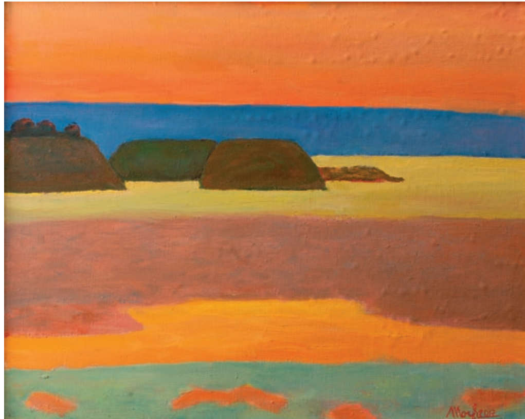
Захід сонця на Азовському морі | 2017 Полотно, олія. 62×76