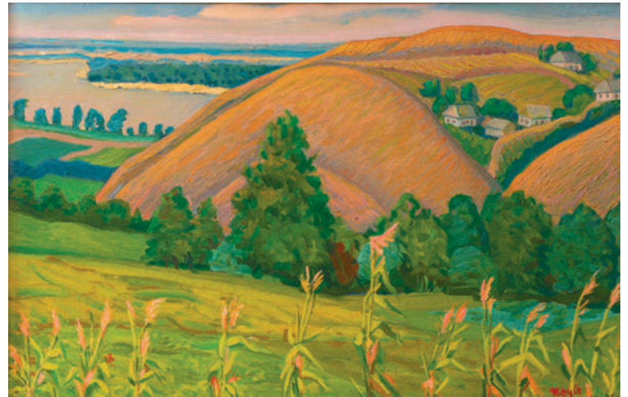
Село Щучинка. Краєвид | 1964 Картон, олія. 49×75